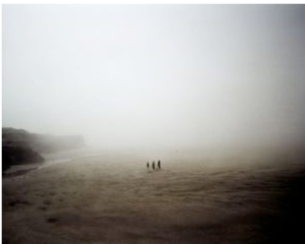
Three ladies de Guillaume Amat